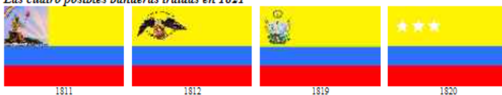
Las cuatro posibles banderas traídas en 1821

A pesar de las posibles diferencias en el escudo o estrellas que llevaba la bandera tricolor traída por Sucre y sus tropas, de lo que no hay duda es del orden de sus colores y las dimensiones de sus franjas, pues no se decretaron cambios desde su aprobación en 1811.